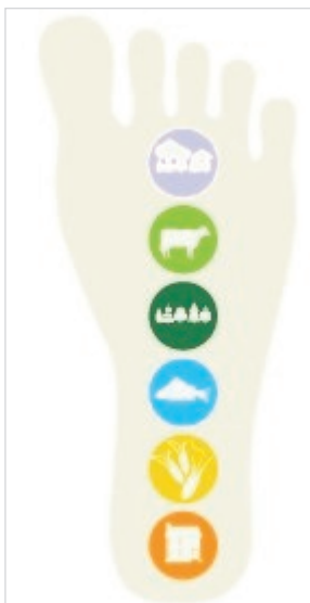
Abbildung 2: Zusammensetzung des ökol. Fußabdrucks.

Die Hauptverantwortung für die Übernutzung der Erde trägt der Umweltstiftung zufolge weiterhin der reiche Norden. „Das Wirtschaftswachstum wohlhabender Staaten findet auf Kosten der ärmsten Länder statt, die am meisten natürliche Ressourcen beisteuern und selbst am wenigsten verbrauchen“, sagt Brandes. Wären alle Menschen US-Amerikaner, bräuhete man derzeit (nach dem Fußabdruck-Modell gerechnet) vier Planeten, beim deutschen Wohlstandsniveau etwa 2,5, beim indonesischen aber nur 0,7. Die wohlhabenden Länder konsumieren im Schnitt dreimal so viel wie Länder mit mittlerem Wohlstandsniveau und fünfmal so viel wie Länder mit niedrigem Wohlstandsniveau.